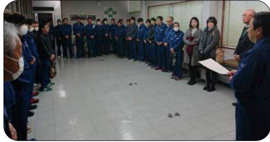
感謝の気持ちを忘れず謙虚に貪欲に学んでいきます！