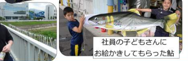
社員の子どもさんにお絵かきしてもらった鮎