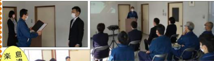
島津寿司さんで楽しく懇親会♪

コロナ禍で例年とは違う採用活動&就職活動の中、こうして結ばれたご縁に感謝です！残りの学生生活を楽しく、来春元気な姿で会えるのを楽しみにしています♪