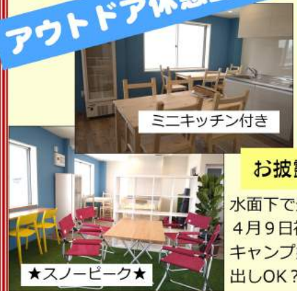
ミニキッチン付き