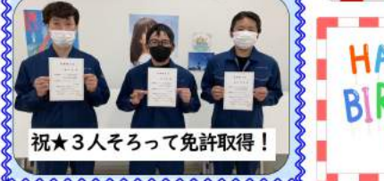
祝★3人そろって免許取得!

4日間みっちり講習を受けてきた3名。製造業の要である安全について学んできました。その間フォローしてきた仲間のためにも、行かせてくれた会社のためにも、得た知識をしっかりと仕事に活用していきましょう!