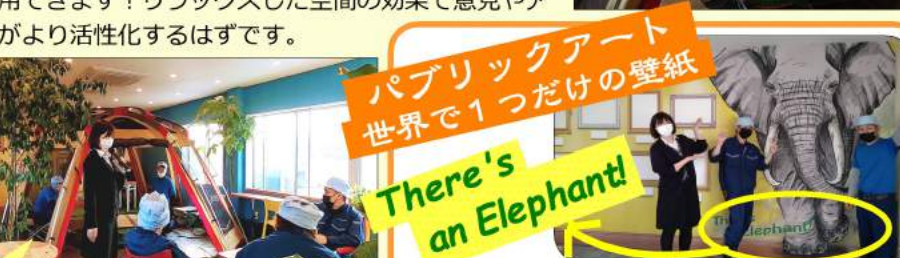
パブリックアート 世界で1つだけの壁紙 There's an Elephant!

英語で"elephant in the room"は気まずい話題、気になっているけど話にくい話題があるという言葉があります。壁には「象がいるってば!!!」と声を挙げようというメッセージが描かれています。この部屋が、腹を割って何でも言い合える場になればという願いが込められています。