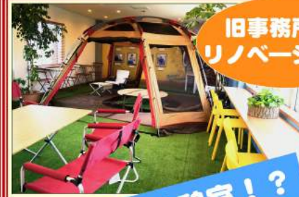
旧事務所を リノベーション