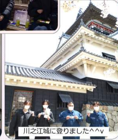
川之江城に登りました^^v