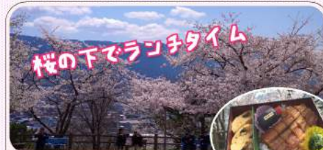
桜の下でランチタイム

例年はみんなで会食するのですが、コロナ禍なので換気抜群の屋外で(笑)。桜満開の川之江城でお花見しながらお弁当を食べました。制限のある中でもできることを見つけて