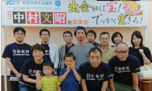
中村さんの話を生で聞いた幸運のメンバー「頼まれごととは試されごと」実践していきましょう！！