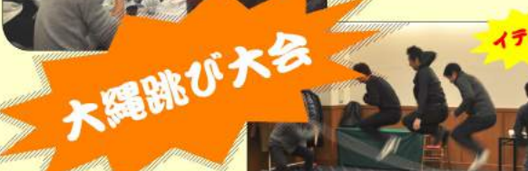
試行錯誤しながらゲームを発案してくれた ウィンダーチームのみなさん、楽しかったです! 年齢を痛いほど感じさせられましたね(笑&泣)