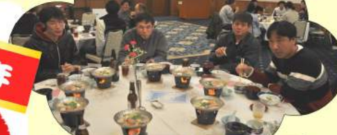
遠方通勤者が多いですね! 年間精勤賞