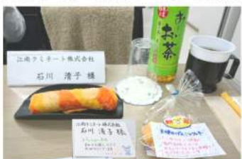
↑西精工(株)さんにて。おもてなしの心で迎えてくれました。

【社員の幸せ】ってなんだろう。その答えを求めて2日間にわたり4つの会社を見に行ってきました。特に衝撃だったのは、徳島県にある西精工(株)さん。ネジのナットの製造会社です。毎朝1時間の朝礼。社是、社訓に対して今週何をしていくかを一人ずつ発表してきます。木鶏会みたいですね。でも毎朝なんです！毎朝1時間！しかも立ちっぱなし！決してやらされている感はなく、仲間を認め合い、朝礼をしたら「今日一日頑張るぞ」と気合が入るそうです。工場内を見学させてもらったときは「こんにちには！」「こんにちには！」と作業の手を止めて、声をかけてくれました。『下町ロケット』のドラマのシーンみたいでしたよ！コミュニケーションや人との対話を大切にしている会社ですが、変革し始めは社員さん