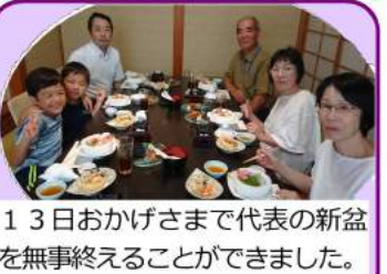
13日おかげさまで代表の新盆が無事終えることができました。

第5回はコンセンサス(全員の合意)による集団決定のグループワークを通じて、その大切さや充実感、納得感を体感し学びました。コンセンサスは時間もかかることですが、一人ひとりの責任感、自主性も培われ最終的には近道になるのかもですね。取り入れていきましょう！