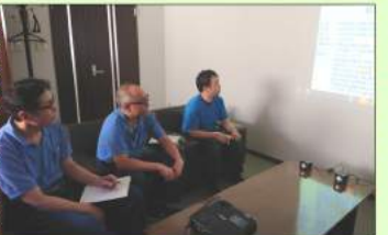
コロナが収束したら、ぜひ工場見学もさせてもらいたいですね。

第2、第3工場に続き今回は第1工場のメンバーがZOOMで受講。自分たちで掃除することでキレイを維持しようという気持ちが生まれるとのこと。できることから1つずつやっていきましょう!