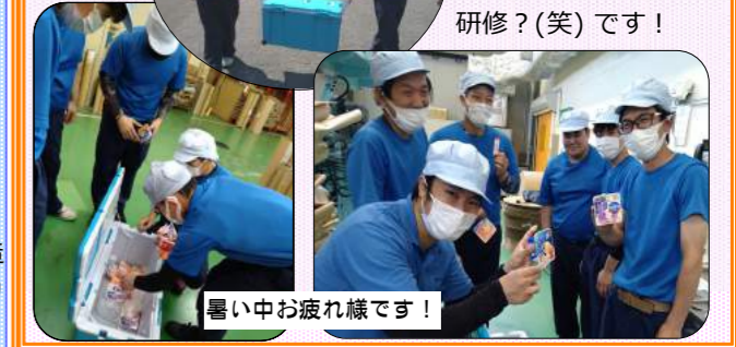
暑い中お疲れ様です!

今夏は猛暑(TOT)早くも差し入れとなった第1弾のアイスが"爽"アイスボーイは新入社員の2人。毎年恒例の研修?(笑)です!