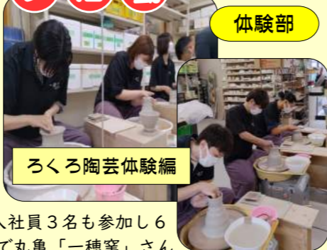
ろくろ陶芸体験編