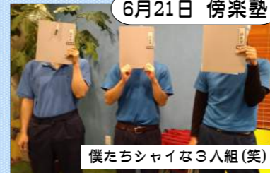
僕たちシャイな3人組(笑)

技能職に携わっている社員対象で全4講。デジタル化、ロボット化が進んでいる現代において、これからの時代に必要となる技能職者となるための学習会。コミュニケーション、創造力...はたらく喜びを捉え直し、能力を発揮して欲しいですね!