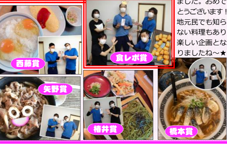
最優秀賞 西藤賞 食レボ賞 矢野賞 橋本賞 橋井賞

社内SNSで投稿する写真コンテスト第2弾はグルメコンテスト。他県、他市より入社した4名に美味しいお店を教えあげよう!というのが趣旨。その4名が審査員となり約50投稿の中から6名が受賞しました。おめでとうございます!