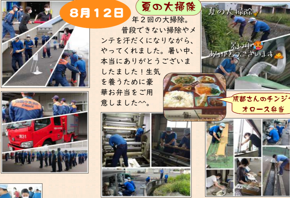
成都さんのチンジャオロース弁当

年2回の大掃除。普段できない掃除やメンテナンスを汗だくになりながら、やってくれました。暑い中、本当にありがとうございました！生気を養うために豪華お弁当をご用意しました。