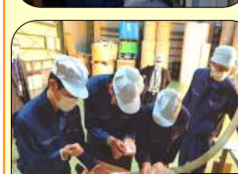
第2工場：ラミネート製品や原料の樹脂を興味津々に手に取る姿が見られました