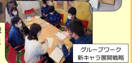
グループワーク 新キャラ展開戦略