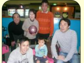
川之江中央ボールにて2011年 懐かしい...